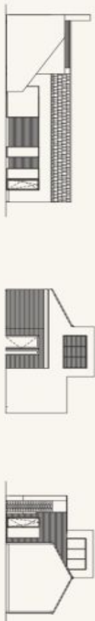
Schéma půdorysu domu představuje dispozici řešení domu. Kuchynská linka a nábytek nejsou součástí dodávky domu, zřízení je zahrnuto pouze pro názornost. Specifikace pro konstrukci, povrchové úpravy a rozložení vybavení je předmětem přílohy "Standard nemovitosti". Developer si vyhrazuje právo na změny a upřesnění bez předchozího upozornění!