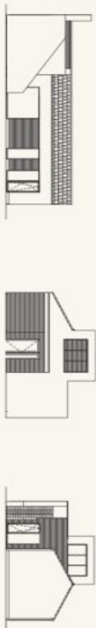
Schéma půdorysu domu představuje dispozici řešení domu. Kuchynská linka a nábytek nejsou součástí dodávky domu, zřízení je zahrnuto pouze pro názornost. Specifikace pro konstrukci, povrchové úpravy a rozsochí vybavení je předmětem přílohy "Standard nemovitosti". Dávající si výhradně právo na změny a upřesnění bez předchozího upozornění!