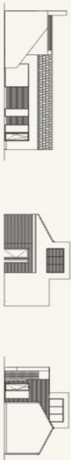
Schéma půdorysu domu představuje dispozici řešení domu. Kuchynská linka a nábytek nejsou součástí dodávky domu, zřízení je zahrnuto pouze pro názornost. Specifikace pro konstrukce, povrchové úpravy a rozsoch výtvarně je předmětem přílohy "Standard nemovitosti". Dávající si výhradně právo na změny a upřesnění bez předchozího upozornění!