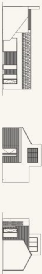
Schéma půdorysu domu představuje dispozici řešení domu. Kuchynská linka a nábytek nejsou součástí dodávky domu, zřízení je zahrnuto pouze pro názornost. Specifikace pro konstrukce, povrchové úpravy a rozsochí vybavení je předmětem přílohy "Standard nemovitosti". Dávající si výrazuje právo na změny a upřesnění bez předchozího upozornění!