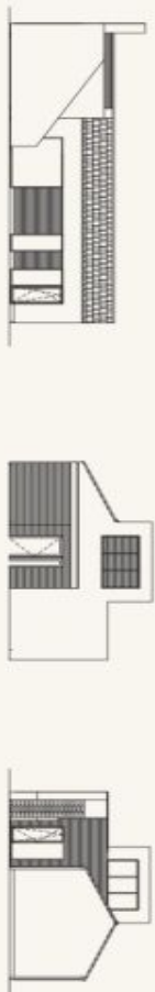
Schéma půdorysu domu představuje dispozici řešení domu. Kuchynská linka a nábytek nejsou součástí dodávky domu, zřízení je zahrnuto pouze pro názornost. Specifikace pro konstrukce, povrchové úpravy a rozsoch výtvarení je předmětem přílohy "Standard nemovitosti". Dávající si výhradně právo na změny a upřesnění bez předchozího upozornění!