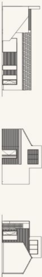
Schéma představené domu představuje dispozici řešení domu. Kuchynská linka a nábytek nejsou součástí dodávky domu, zřízení je zobrazeno pouze pro názornost. Specifikace pro konstrukce, povrchové úpravy a rozsah vybavení je předmětem přílohy "Standard nemovitosti". Developer si vyhrazuje právo na změny a upřesnění bez předchozího upozornění.