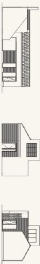
Schéma půdorysu domu představuje dispozici řešení domu. Kuchynská linka a nábytek nejsou součástí dodávky domu, zřízení je zobrazeno pouze pro názornost. Specifikace pro konstrukce, povrchové úpravy a rozsah vybavení je předmiotem přílohy "Standard nemovitosti". Developer si vyhrazuje právo na změny a upřesnění bez předchozího upozornění.