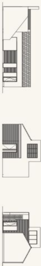
Schéma předstírá domů představuje dispozici řešení domu. Kuchynská linka a nábytek nejsou součástí dodávky domu, zřízení je zobrazeno pouze pro názornost. Specifikace pro konstrukci, povrchové úpravy a rozsah vybavení je předmětem přílohy "Standard nemovitosti". Developer si vyhrazuje právo na změny a upřesnění bez předchozího upozornění.