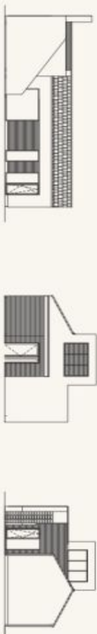
Schéma předstírá domů představuje dispozici řešení domu. Kuchynská linka a nábytek nejsou součástí dodávky domu, zřízení je zobrazeno pouze pro názornost. Specifikace pro konstrukce, povrchové úpravy a rozsah vybavení je předmětem přílohy "Standard nemovitosti". Developer si vyhrazuje právo na změny a upřesnění bez předchozího upozornění.