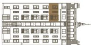
Schéma půdorysu bytu představuje dispozici řešení bytu. Kuchyňská linka a nábytek nejsou součástí dodávky bytu, zařízení je zobrazeno pouze pro názornost. Plocha zahrady je orientační. Specifikace pro konstrukce, povrchové úpravy a rozsah vybavení je předmětem přílohy "Standard nemovitosti".

svoboda&williams | CHRISTIE'S INTERNATIONAL REAL ESTATE