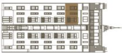
Schéma půdorysu bytu představuje dispoziční řešení bytu. Kuchyňská linka a nábytek nejsou součástí dodávky bytu, zařízení je zobrazeno pouze pro názornost. Plocha zahrady je orientační. Specifikace pro konstrukce, povrchové úpravy a rozsah vybavení je předmětem přílohy "Standard nemovitosti".

svoboda&williams | CHRISTIE'S INTERNATIONAL REAL ESTATE