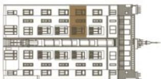
Schéma půdorysu bytu představuje dispozici řešení bytu. Kuchyňská linka a nábytek nejsou součástí dodávky bytu, zařizování je zobrazeno pouze pro názornost. Plocha zahrady je orientační. Specifikace pro konstrukce, povrchové úpravy a rozsah vybavení je předmětem přílohy "Standard nemovitosti".

svoboda&williams | CHRISTIE'S INTERNATIONAL REAL ESTATE