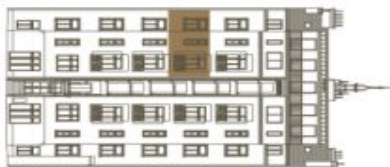
Schéma půdorysu bytu představuje dispoziční řešení bytu. Kuchyňská linka a nábytek nejsou součástí dodávky bytu, zařazení je zobrazeno pouze pro názornost. Plocha zahrady je orientační. Specifikace pro konstrukce, povrchové úpravy a rozsah vybavení je přednětém přílohy "Standard nemovitosti".

svoboda&williams | CHRISTIE'S INTERNATIONAL REAL ESTATE