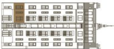
Schéma půdorysu bytu představuje dispoziční řešení bytu. Kuchyňská linka a nábytek nejsou součástí dodávky bytu, zařízení je zobrazeno pouze pro názornost. Plocha zahrady je orientační. Specifikace pro konstrukce, povrchové úpravy a rozsah vybavení je přednětem přílohy "Standard nemovitosti".

svoboda&williams | CHRISTIE'S INTERNATIONAL REAL ESTATE