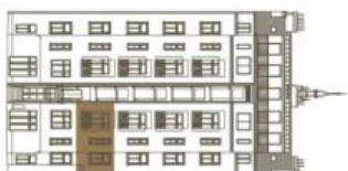
Schéma půdorysu bytu představuje dispozici řešení bytu. Kuchyňská linka a nábytek nejsou součástí dodávky bytu, zařízením je zobrazeno pouze pro názornost. Plocha zahrady je orientační. Specifikace pro konstrukce, povrchové úpravy a rozsah vybavení je předmětem přílohy "Standard nemovitosti".

svoboda&williams | CHRISTIE'S INTERNATIONAL REAL ESTATE