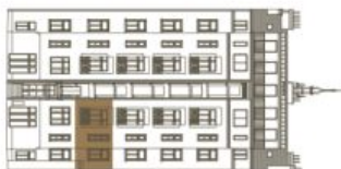
Schéma půdorysu bytu představuje dispozici řešení bytu. Kuchyňská linka a nábytek nejsou součástí dodávky bytu, zařízením je zobrazeno pouze pro názornost. Plocha zahrady je orientační. Specifikace pro konstrukce, povrchové úpravy a rozsah vybavení je předmětem přílohy "Standard nemovitosti".

svoboda&williams | CHRISTIE'S INTERNATIONAL REAL ESTATE