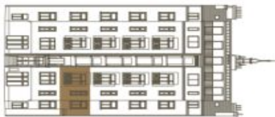
Schéma půdorysu bytu představuje dispoziční řešení bytu. Kuchyňská linka a nábytek nejsou součástí dodávky bytu, zařízení je zobrazeno pouze pro názornost. Plocha zahrady je orientační. Specifikace pro konstrukce, povrchové úpravy a rozsah vybavení je předmětem přílohy "Standard nemovitosti".

svoboda&williams | CHRISTIE'S INTERNATIONAL REAL ESTATE