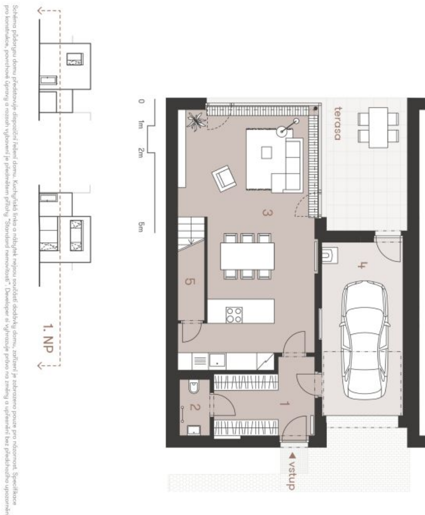
Schéma přílohu jsou předloženy jako doporučení řešení domu. Kuchynská linka a nábytek nejsou součástí smlouvy domu, zařízení je zahrzeno pouze pro názornost. Specifikace pro konstrukci, povrchové úpravy a rozsah vybavení je předložena přílohou "Standardní specifikace". Developer si vyhrazuje právo na změny a upřesnění bez předchozího upozornění.