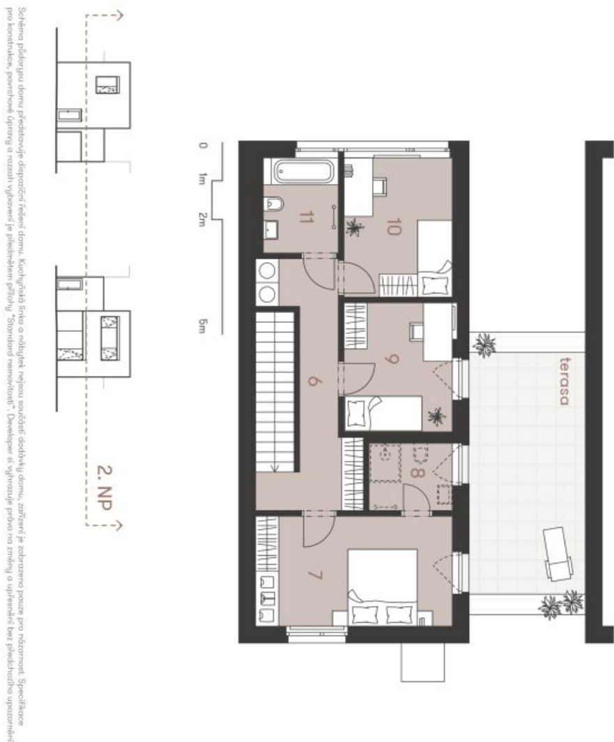
Schéma přílohu jsou předloženy s výhradou, že není záruka za jejich přesnost. Kuchynská linka a nábytková souprava jsou zobrazeny pouze pro názornost. Specifikace pro konstrukci, povrchové úpravy a rozložení je předložena v příloze "Standard specification". Developer si vyhrazuje právo na změny a upřesnění bez předchozího upozornění.