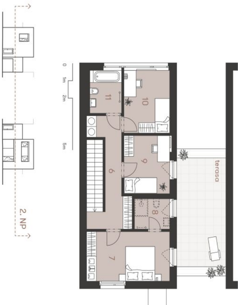
Schéma podlažní domu představuje dispozici řešené domu. Kuchynská linka a nábytek nejsou součástí standardu domu, zobrazeno pouze pro názornost. Specifikace pro konstrukci, povrchové úpravy a rozsah vybavení je přednětem přílohy "Standard nemovitosti". Developer si vyhrazuje právo na změny a upřesnění bez předchozího upozornění.