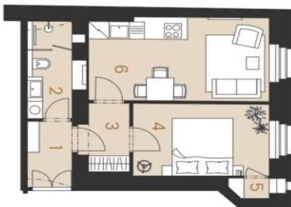
Schéma půdorysu bytu představuje dispozici včetně bytu. Kuchynské linka a nábytek nejsou součástí dodávky bytu, zařazení je zobrazeno pouze pro názornost. Speciálizace pro kanceláře, povrchové úpravy a materiál vyhovují je předem určené přílohy "Standard nemovitosti".

svoboda&williams | CHRISTIE'S INTERNATIONAL REAL ESTATE