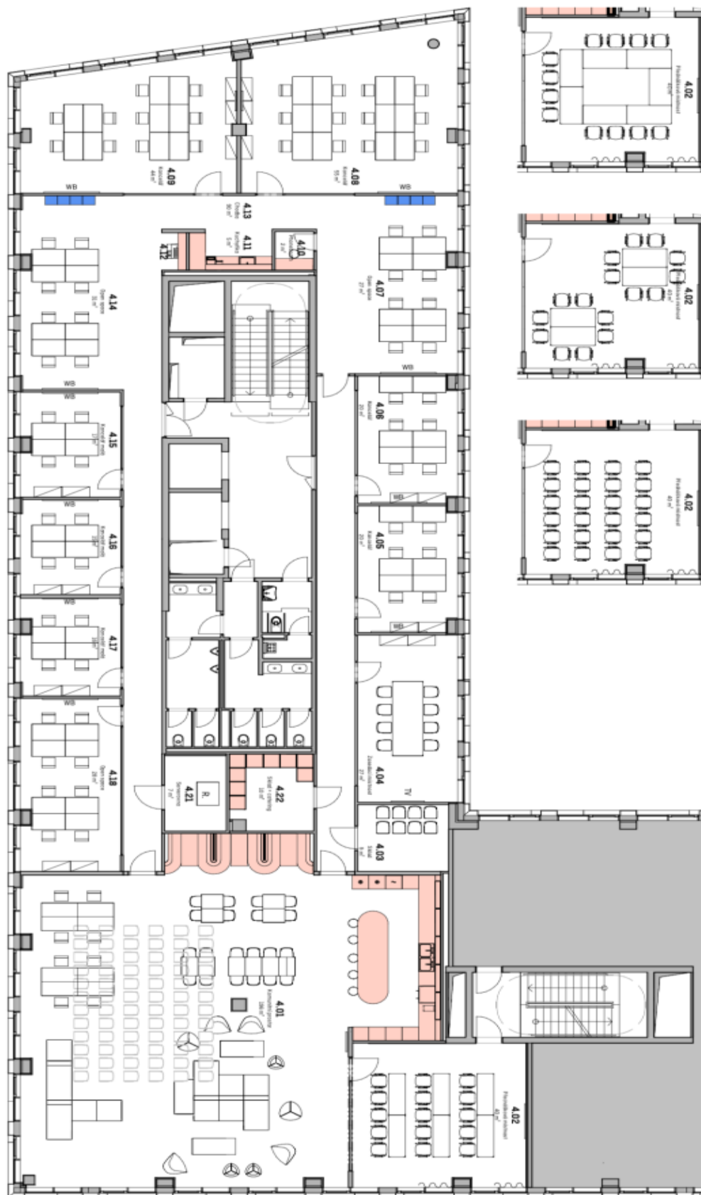
Varianty uspořádání místnosti 4.02