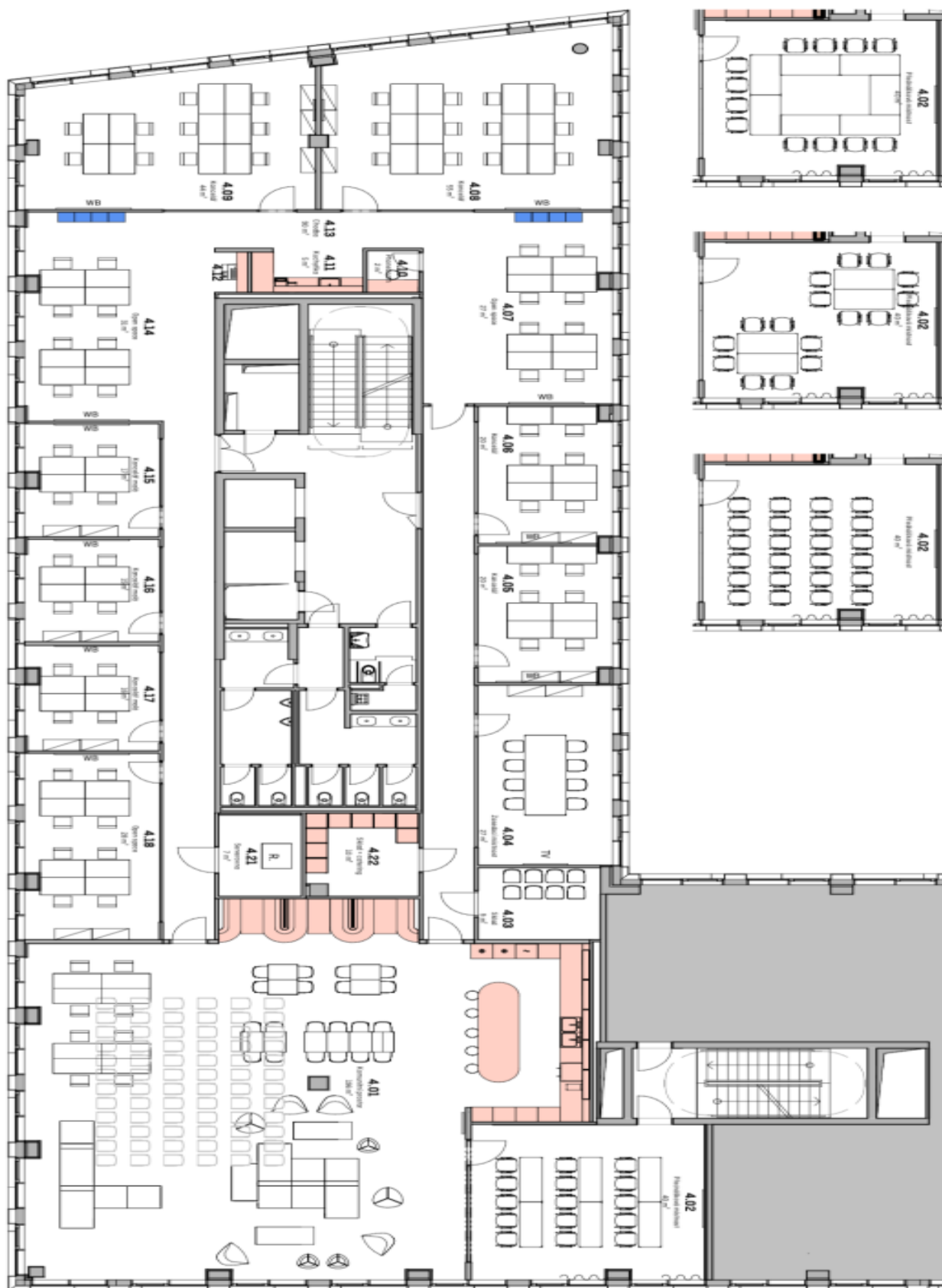
Varianty uspořádání místnosti 4.02