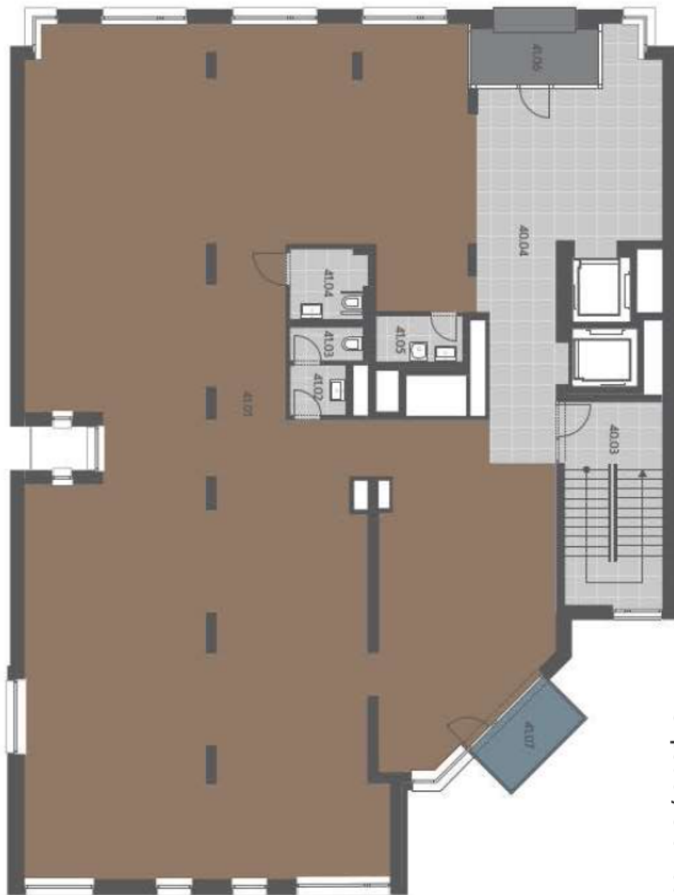
3. patro / 3rd floor