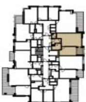
schéma podlaží schematic floor plan

Upozornění: Plochy jednotlivých místností jsou pouze orientační. Vybírazené zařízení v plánech bytů (nábytek, kuch. linka, el. spotřebiče atd.) není součástí dodávky. Rozsah dodávky je specifikován ve standardu. Note: This drawing is for illustration only. The set up of interior (furniture, kitchen, el. appliance, etc.) featured in the apartment drawings is not subject of delivery. The scope of delivery is specified in the standard. (2.1.10.2015)