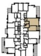
schema podlaží schematic floor plan

Upozornění: Plochy jednotlivých místností jsou pouze orientační. Vybavené zařízení v plánech bytů (nábytek, kuch. linka, el. spotřebiče atd.) není součástí dodávky. Rozsah dodávky je specifikován ve standardu. Note: This drawing is for illustration only. The set up of interior (furniture, kitchen, el. appliance, etc.) featured in the apartment drawings is not subject of delivery. The scope of delivery is specified in the standard. (21.10.2015)