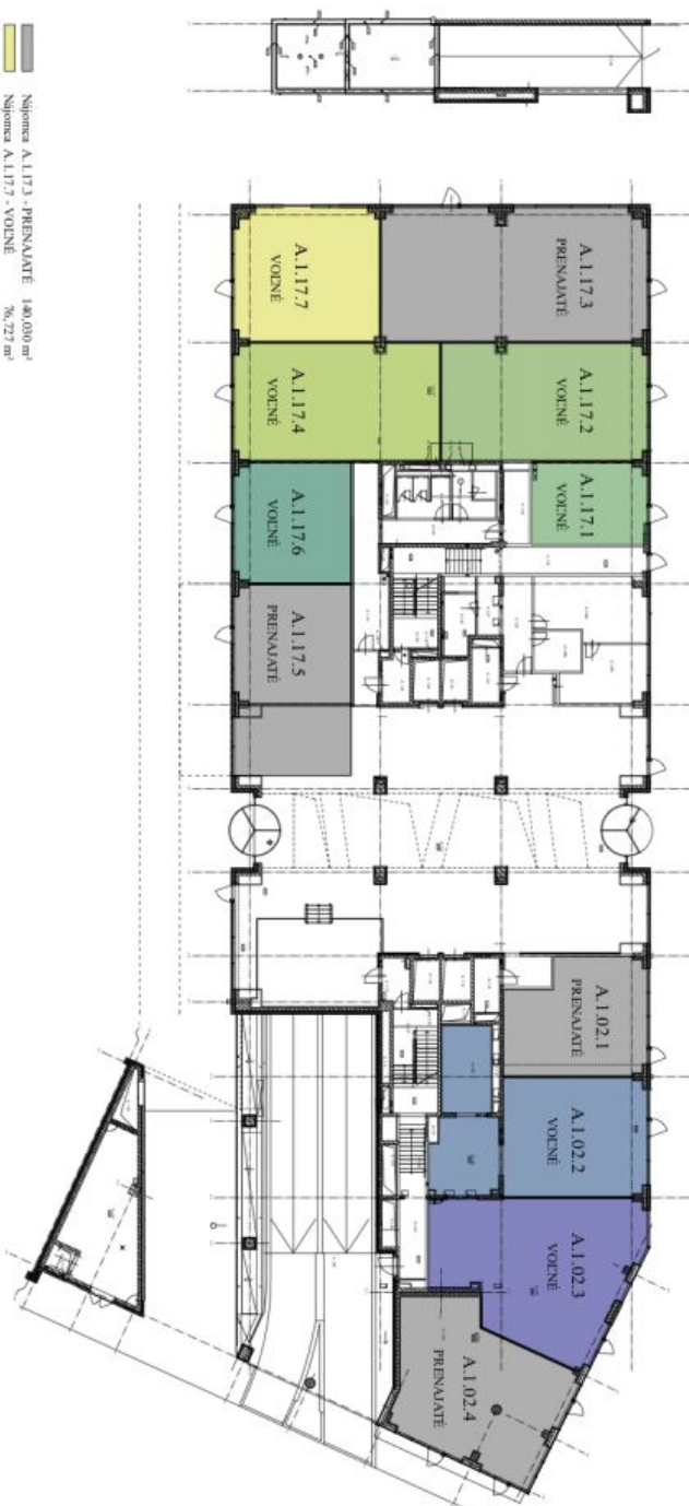
1 NP BOMA measurement standards