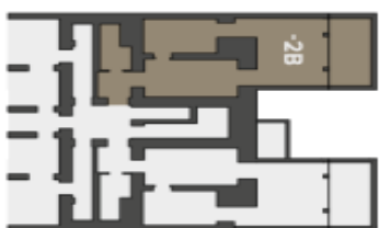
Půdorys podlaží Umístění bytu na patře