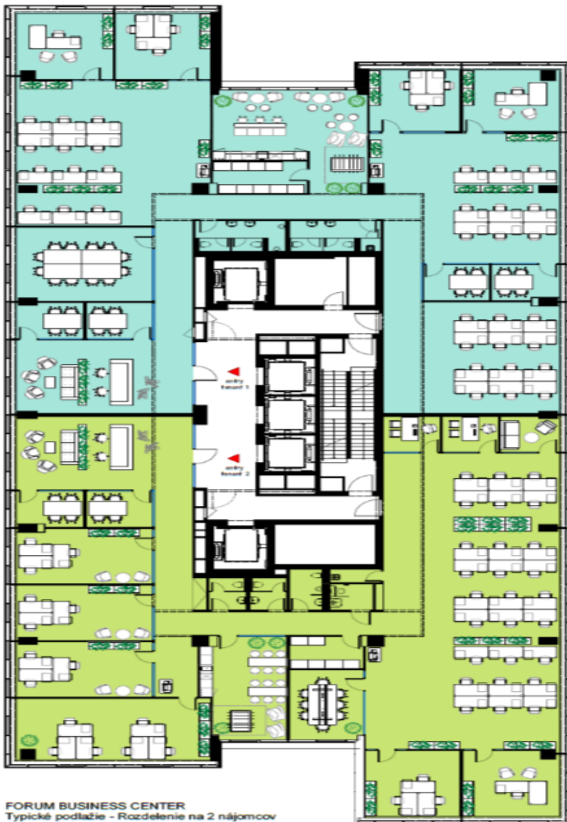
FORUM BUSINESS CENTER Typické podlažie - Rozdelenie na 2 nájomcov