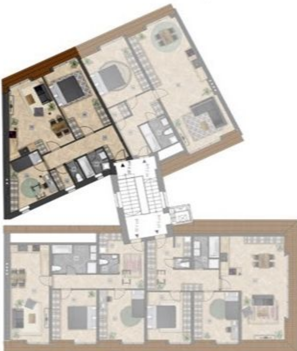
umístění bytu na patře