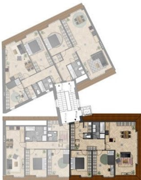
umístění bytu na patře