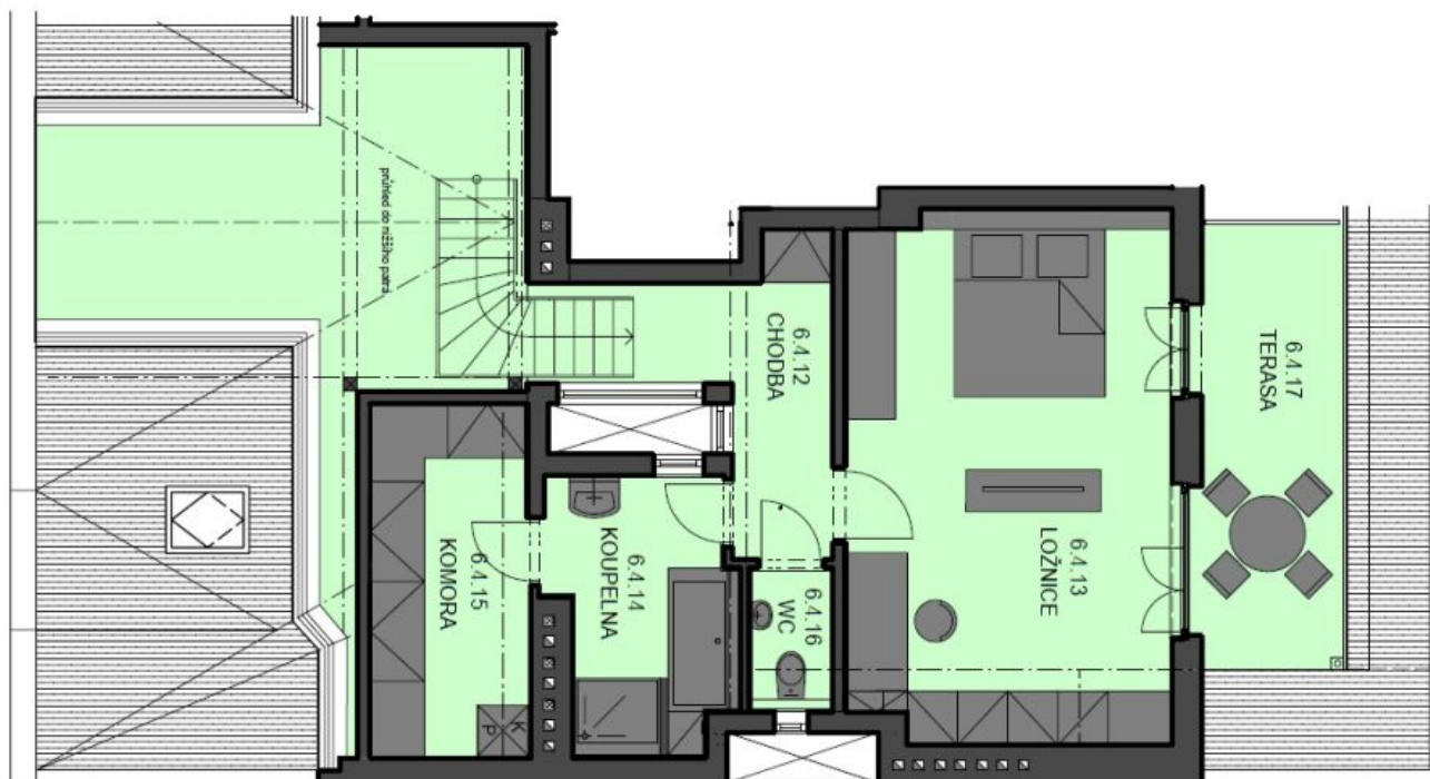
PÜDORYS 7. NP