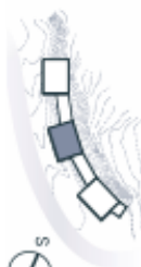
Schéma podlažnosti bytu představuje dispozici i řešení bytu. Kuchynská linka a nábytek nejsou součástí dodávky bytu, zařízení je zobrazeno pouze pro názornost. Plocha zahrady je orientační. Specifikace pro konstrukci, povrchové úpravy a rozsaňi vzhledem le předním orloiv. "Standard nemovitosti".

svoboda&williams | CHRISTIE'S INTERNATIONAL REAL ESTATE