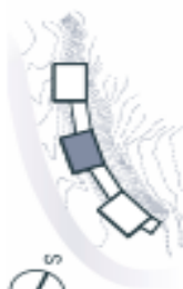
Schéma půdorysu bytu představuje dispoziční řešení bytu. Kuchynská linka a nábytek nejsou součástí dodávky bytu, zařízení je zobrazeno pouze pro názornost. Plocha zahrady je orientační. Specifikace pro konstrukci, povrchové úpravy a rozsah vybavení je předmětem přílohy "Standard nemovitosti".