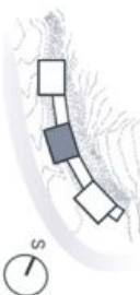
Schéma pldodrysu bytu predstavuje dispozíciu/riadení bytu. Kuchyňská linka a nábytok nie sú súčasťou dodávky bytu, zariadení je zobrazeno pouze pro názornost. Plocha zahrady je orientácia. Specifikace pro konstrukce, povrchové úpravy a rozsah vhašení je předněm úřlohy "Standard nemovitosti".

svoboda&williams | CHRISTIE'S INTERNATIONAL REAL ESTATE