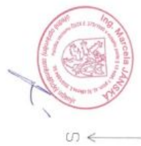
Byt č.12 Eliášova 331/7 Praha 6