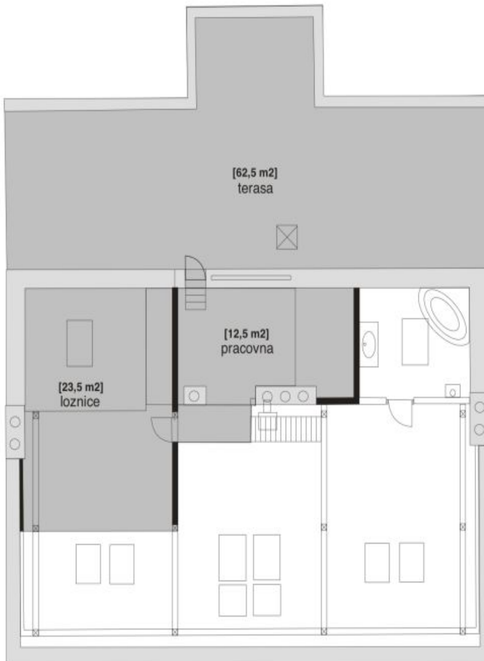
patro s terasou