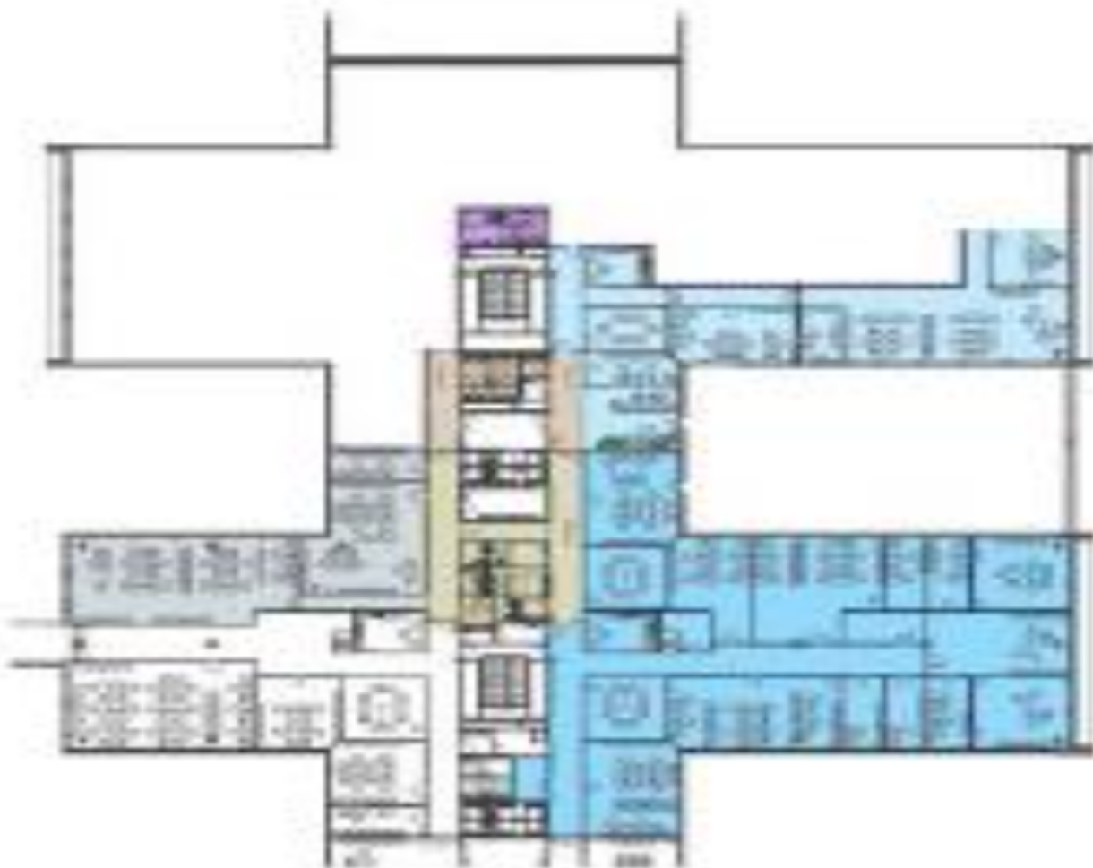
1. patro / 1st floor