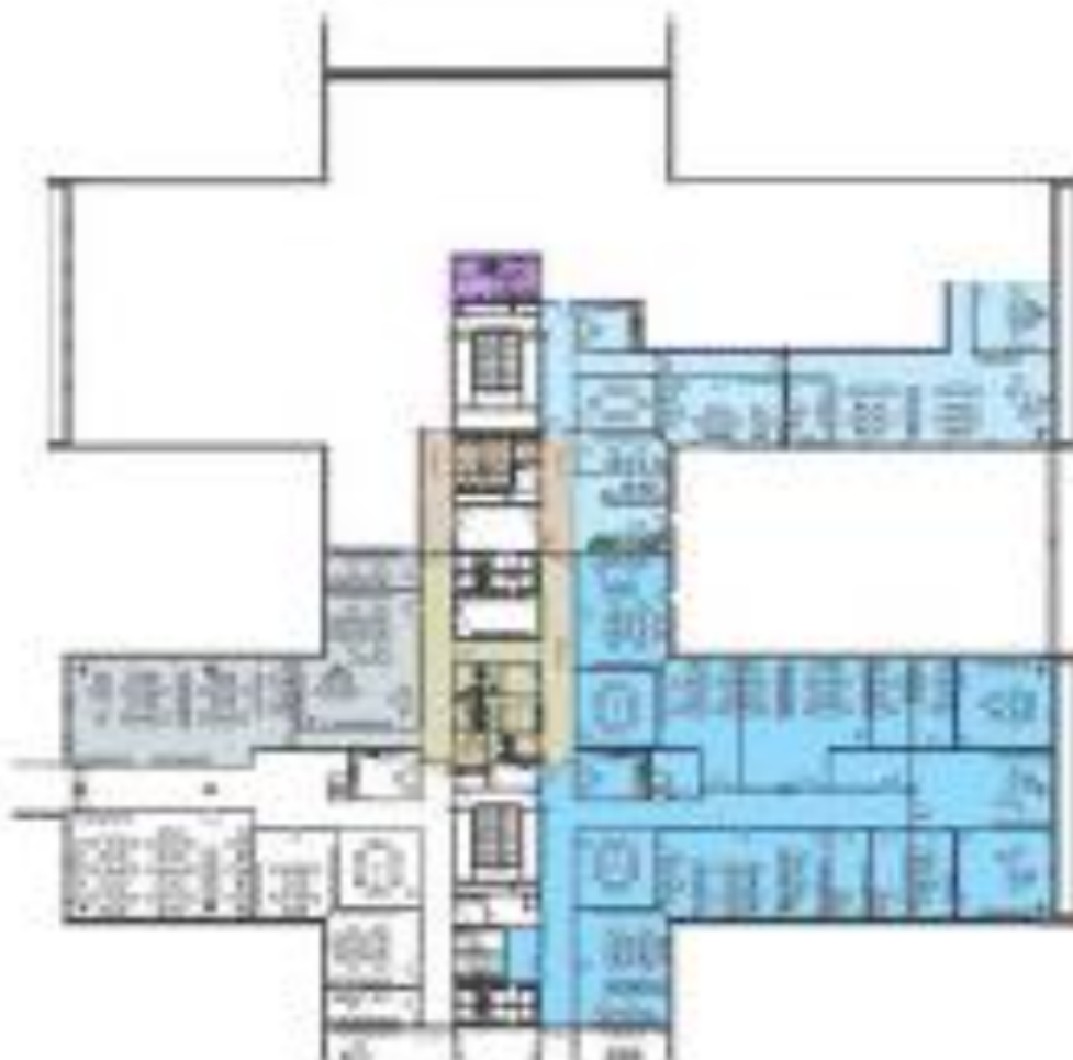
1. patro / 1st floor