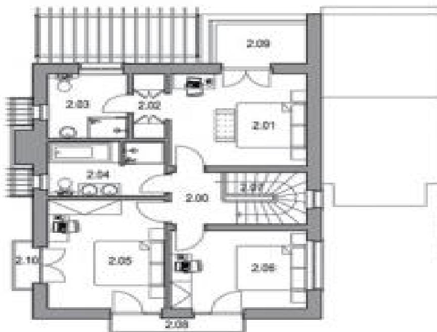
PŮDORYS 2.NP / FIRST FLOOR