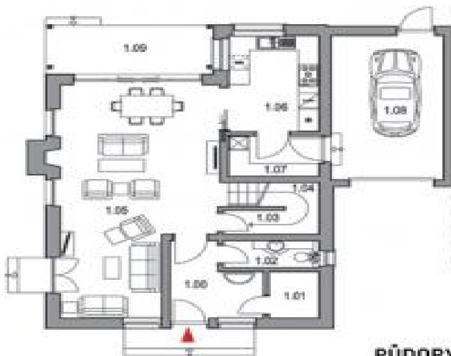
PŮDORYS 1.NP / GROUND FLOOR