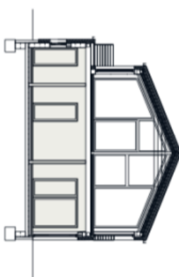
Schéma půdorysu bylo provedeno za účelem ilustrace dispozice řešené bytů a kuchyní jako srovnání srovnání. Byly zobrazeny pouze pro názornost. Specifika pro konstrukci, povrchové úpravy a různé vybavení je předmětem přílohy "Standard nemovitosti".

svoboda&williams | CHRISTIE'S INTERNATIONAL REAL ESTATE