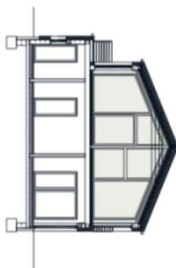
Schéma půdorysu bytu představuje dispozici řešení bytu. Kuchyňská linka a robyřek nejsou součástí dodávky bytu. Zastavení je zadrženo pouze pro nájemník. Specifická pro konkrétní povrchové úpravy a různé vybavení je předmětem přílohy "Standard nemovitosti".

svoboda&williams | CHRISTIE'S INTERNATIONAL REAL ESTATE