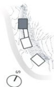
Schéma půdorysu bytu představuje dispoziční řešení bytu. Kuchynská linka a nábytek nejsou součástí dodávky bytu, zařízení je zobrazeno pouze pro názornost. Plocha zahrady je orientáční. Specifikace pro konstrukce, povrchové úpravy a rozsah vybavení je předmětem přílohy "Standard nemovitosti".

Na Perštyne 2, 110 00 Praha 1 +420 257 328 281, +420 257 322 032 info@svoboda-williams.com