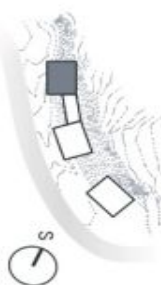
Schéma půdorysu bytu představuje dispoziční řešení bytu. Kuchynská linka a nábytek nejsou součástí dodávky bytu, zařízení je zobrazeno pouze pro názornost. Plocha zahrady je orientáční. Specifikace pro konstrukce, povrchové úpravy a rozsah vybavení je předmětem přílohy "Standard nemovitosti".