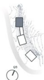
Schéma podrobně bytu představuje dispozici řešení bytu. Kuchyňská linka a nábytek nejsou součástí dodávky bytu, zařízení je zobrazeno pouze pro názornost. Plocha zahrady je orientační. Specifikace pro konstrukce, povrchové úpravy a rozsah vybavení je předmětem přílohy "Standard nemovitosti".