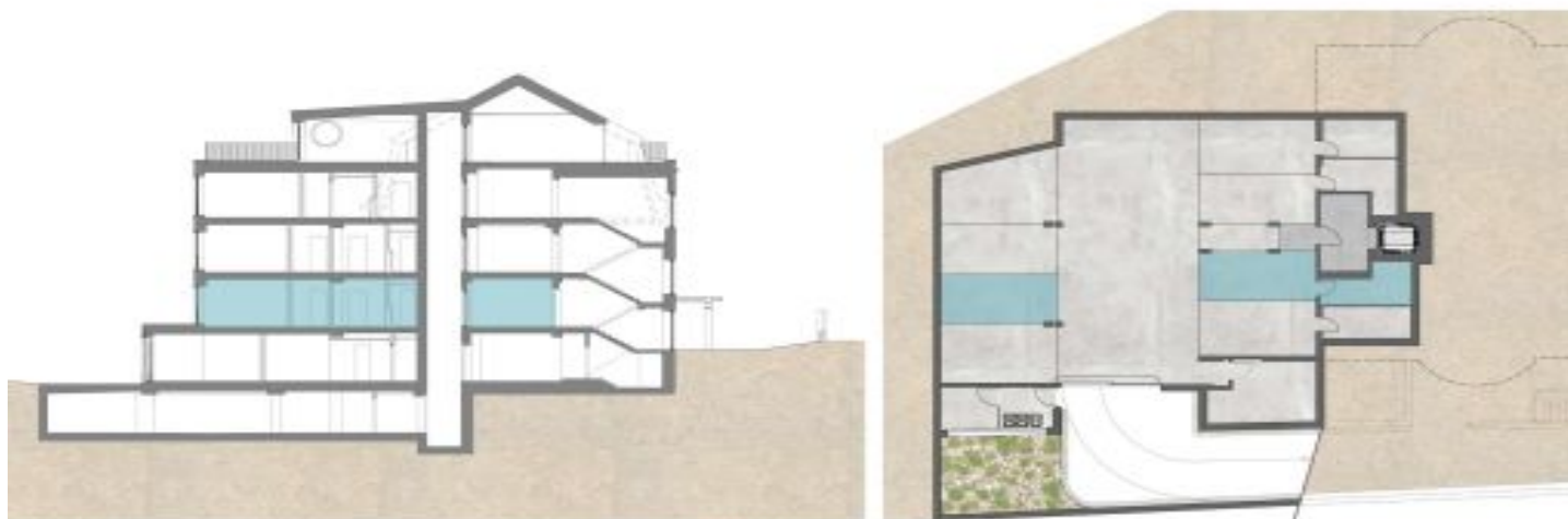
Location within the residence