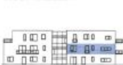
UMÍSTĚNÍ V NÁMĚ POZEMKŮ