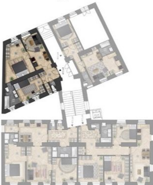
umístění bytu na patře