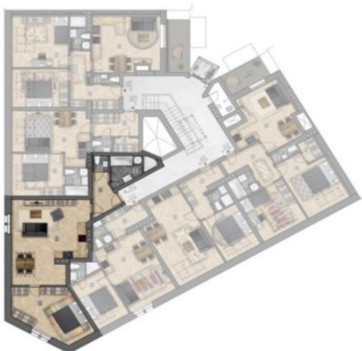
umístění bytu na patře