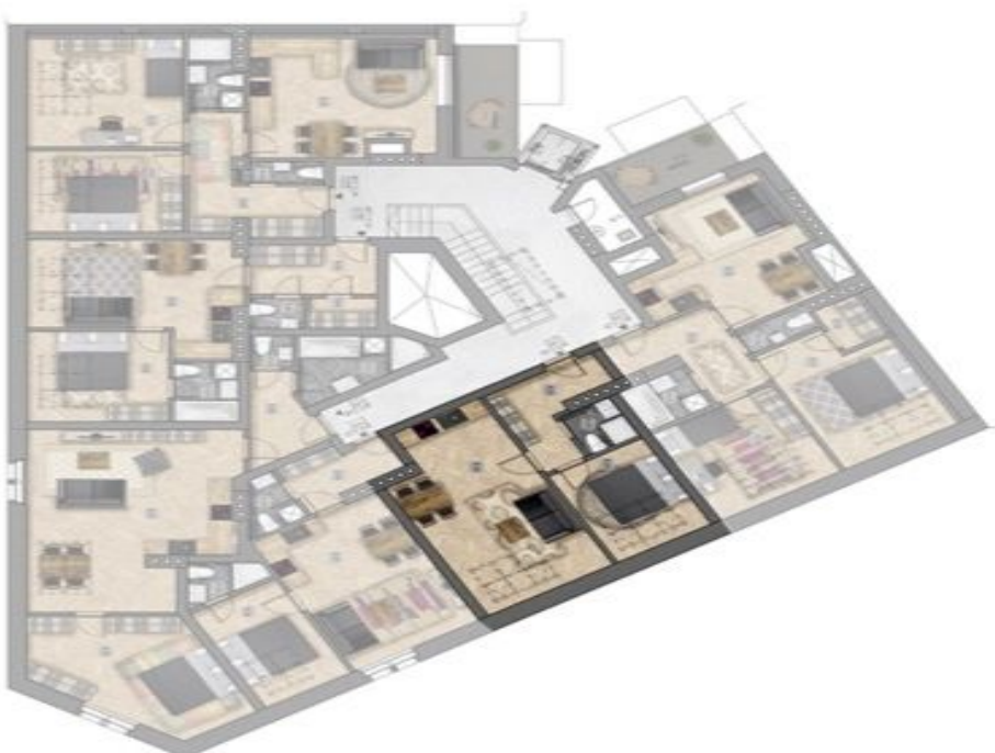
umístění bytu na patře