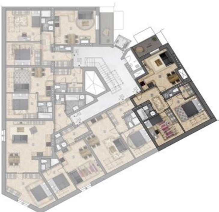
umístění bytu na patře