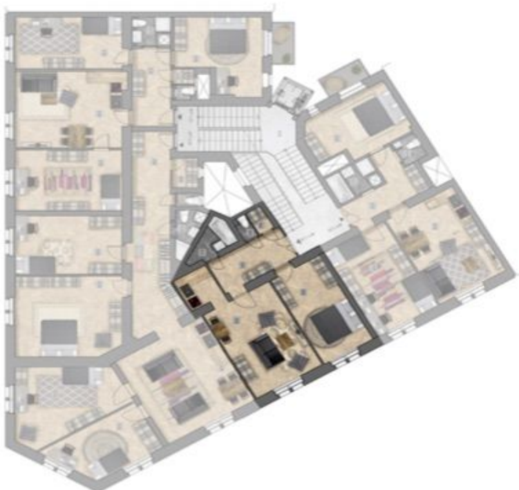
umístění bytu na patře