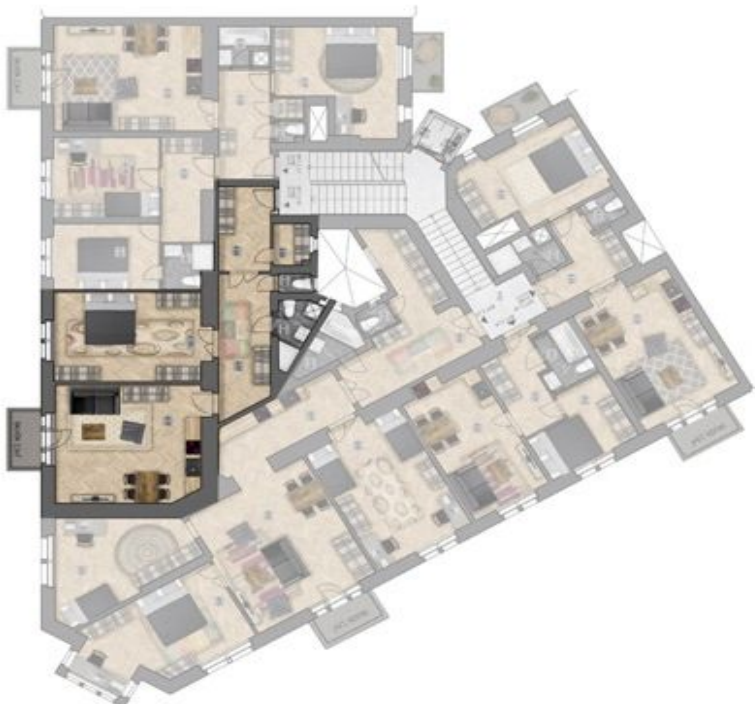
umístění bytu na patře