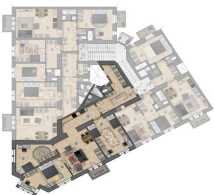
umístění bytu na patře