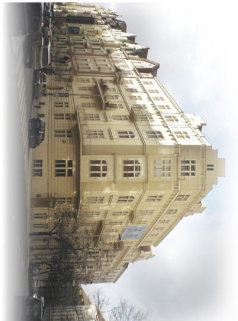
umístění bytu v objektu