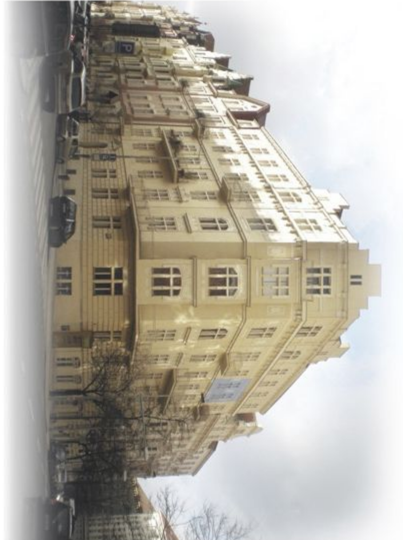
umístění bytu v objektu