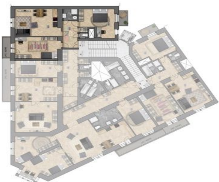
umístění bytu na patře