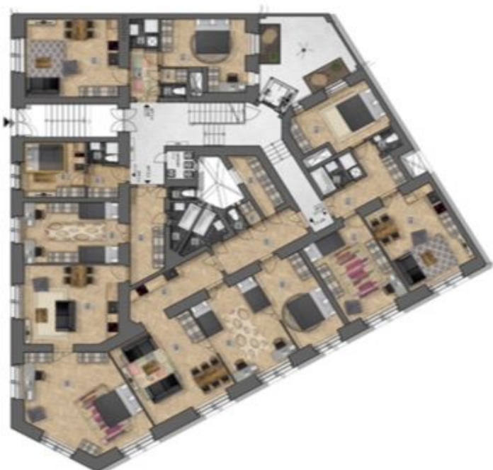
umístění bytu na patře