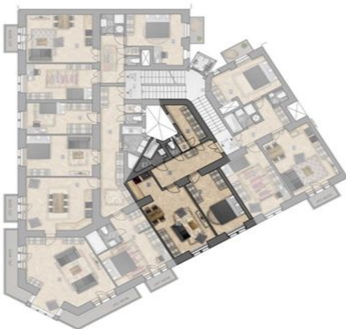
umístění bytu na patře