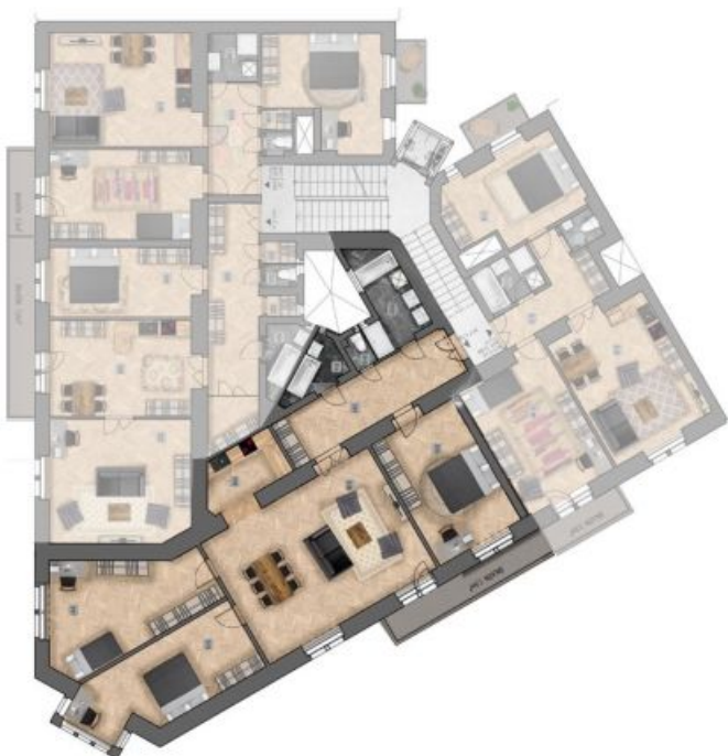
umístění bytu na patře