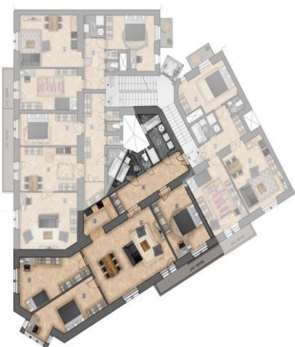
umístění bytu na patře