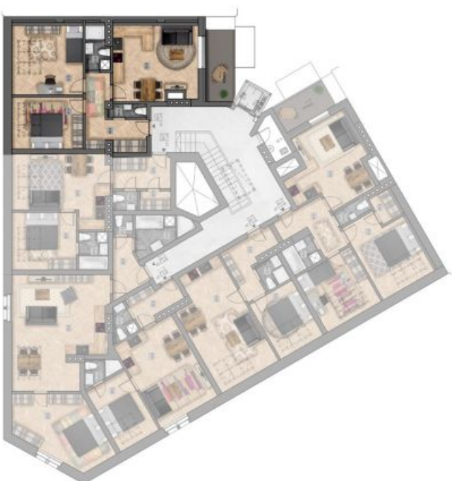
umístění bytu na patře