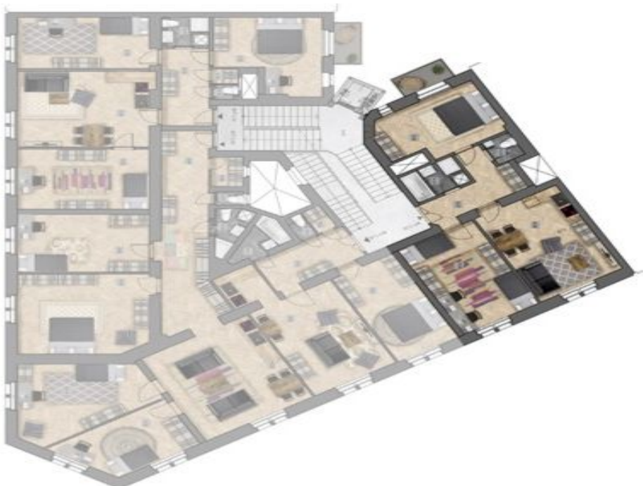
umístění bytu na patře