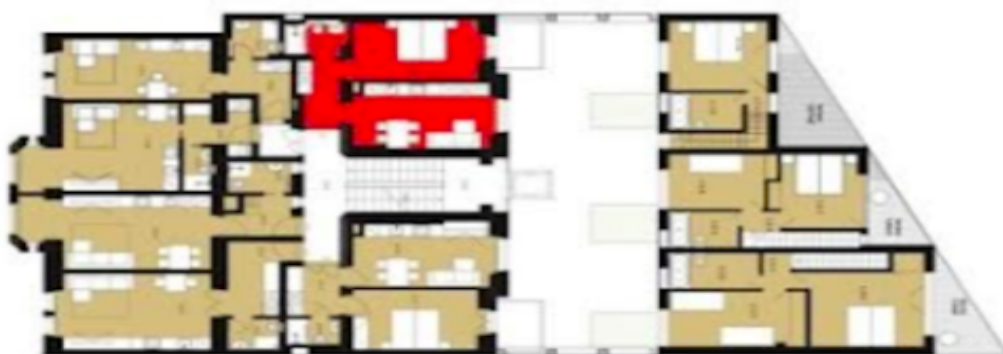
Půdorys 2. NP