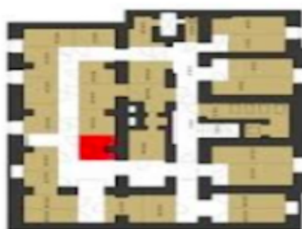
Půdorys 1. PP (sklepy)