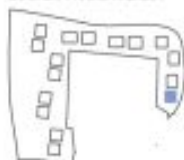
UMÍSTĚNÍ V RÁMCI BUDOVY :