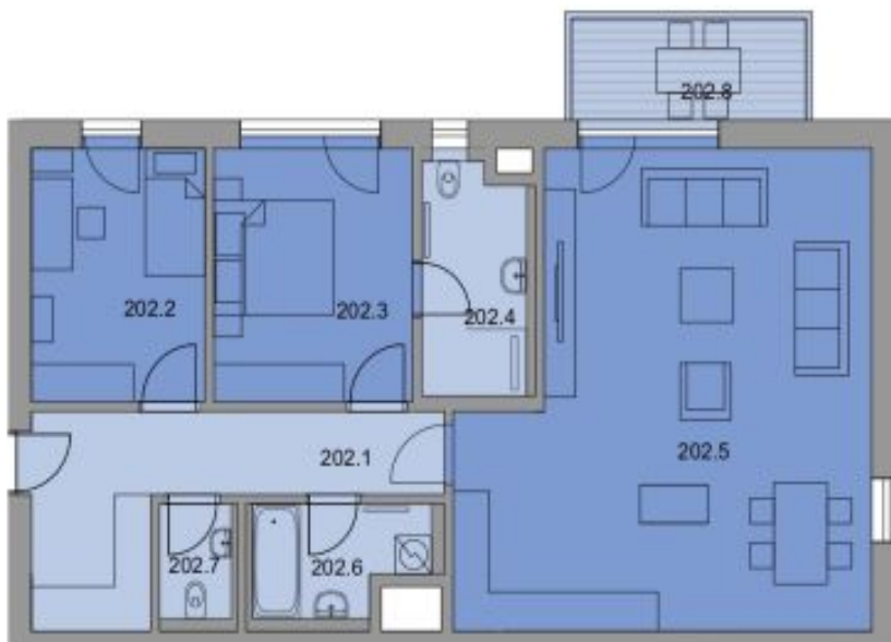
UMÍSTĚNÍ V RÁMCI AREÁLU :